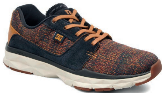
DC SHOES. Player Tx Se. Novedad otoño / invierno