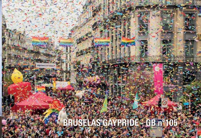
BRUSELAS GAYPRIDE - GB n°105