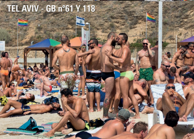
TEL AVIV - GB n°61 Y 118