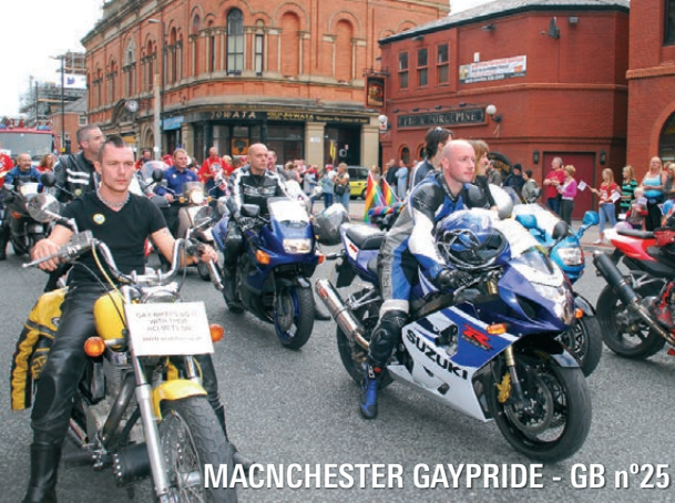
MACNCHESTER GAYPRIDE - GB n°25