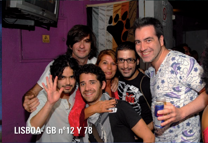
LISBOA - GB n°12 Y 78