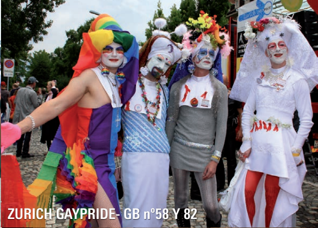
ZURICH GAYPRIDE- GB n°58 Y 82