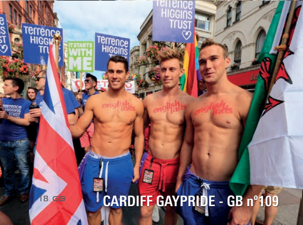
CARDIFF GAYPRIDE - GB n°109