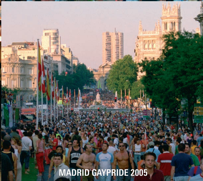
MADRID GAYPRIDE 2005