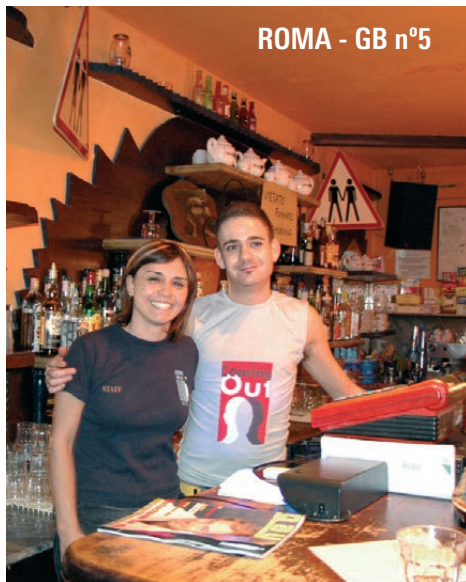
ROMA - GB nº5