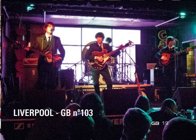
LIVERPOOL - GB n°103