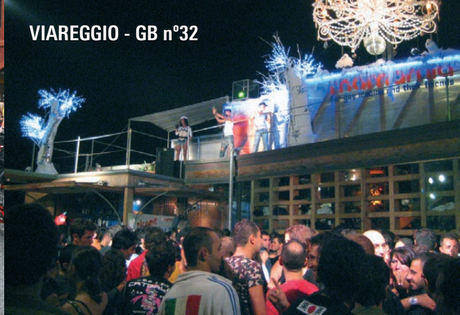
VIAREGGIO - GB n°32