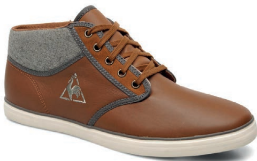
LE COQ SPORTIF. Brancion Lea/Felt. Novedad