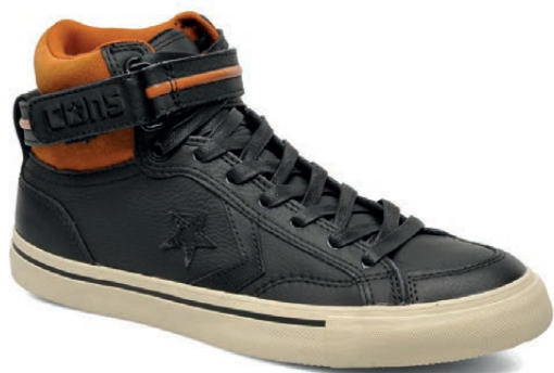
CONVERSE. Star Player Denim Ox M. Novedad otoño