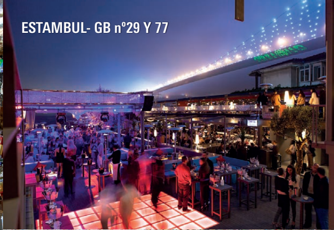
ESTAMBUL - GB n°29 Y 77