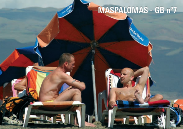
MASPALOMAS - GB n°7