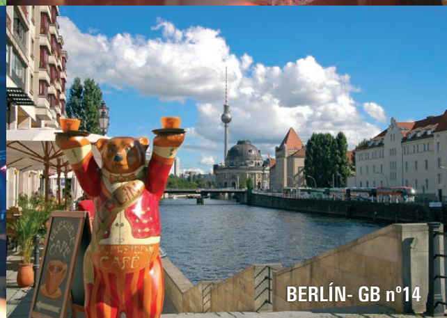
BERLÍN - GB n°14