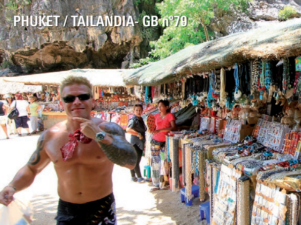
PHUKET / TAILANDIA - GB n°79