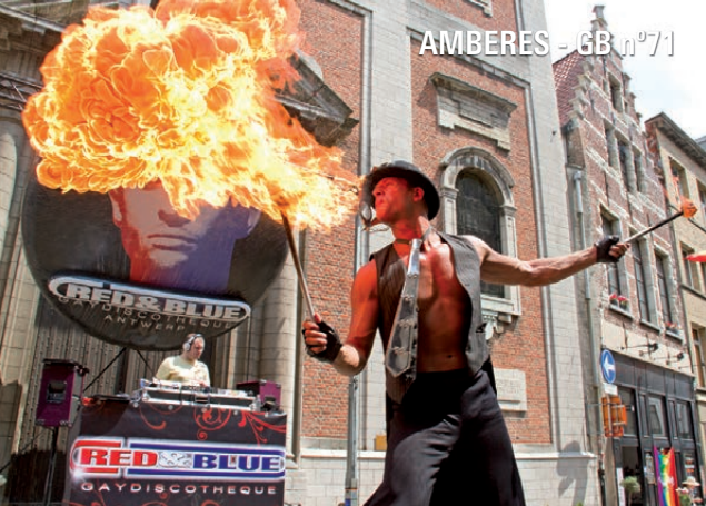
AMBERES - GB n°71