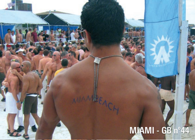
MIAMI - GB n°44