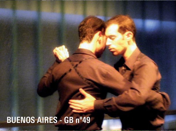
BUENOS AIRES - GB n°49