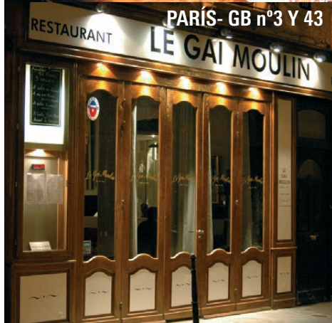
PARÍS- GB nº3 Y 43