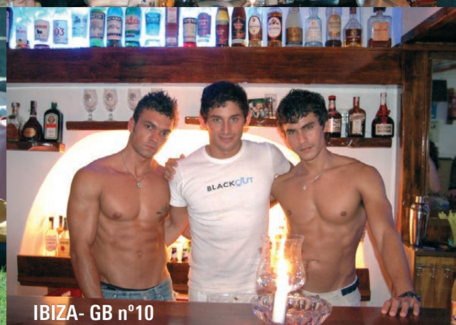
IBIZA - GB n°10