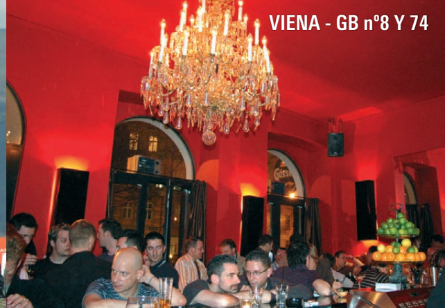
VIENA - GB n°8 Y 74