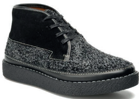
KENZO. Norma. Novedad otoño / invierno