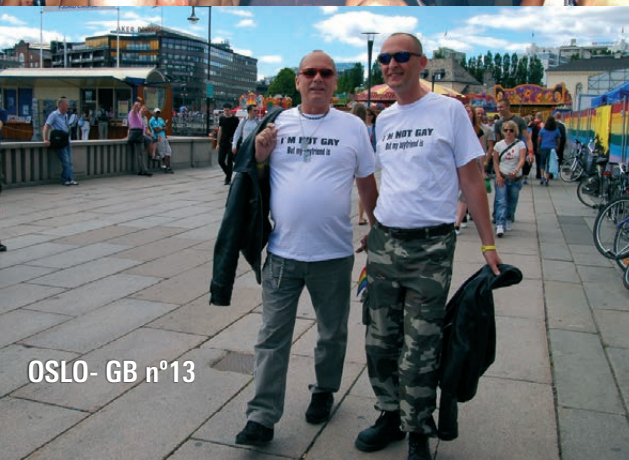
OSLO - GB n°13