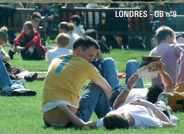
LONDRES - GB n°9