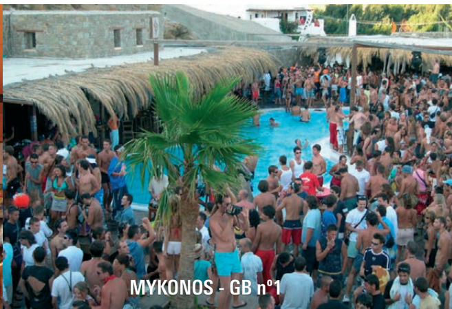
MYKONOS - GB nº1