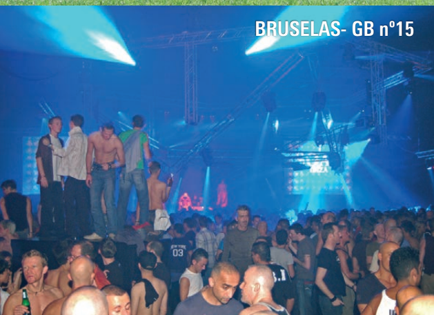
BRUSELAS - GB n°15