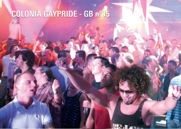
COLONIA GAYPRIDE - GB n°35